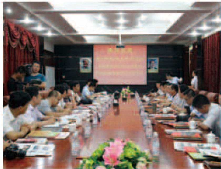
李长云主席此次大型主题采访活动的首场采访对象