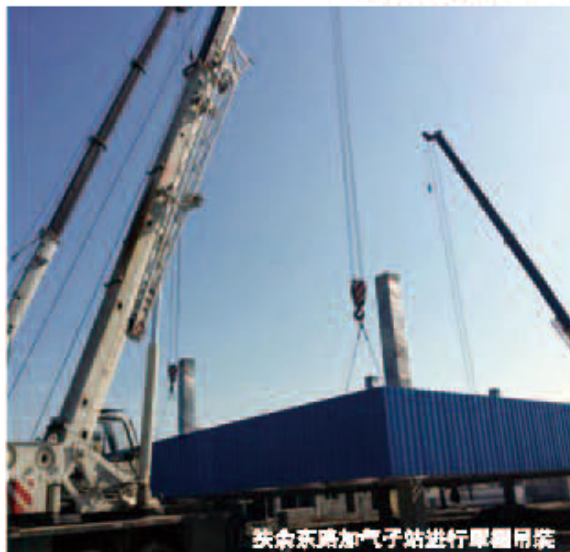
扶余东路加气站进行罐体吊装