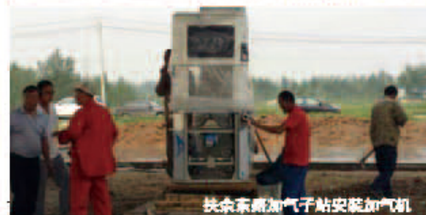
扶余东路加气站安装加气机

集团旗下昆仑燃气有限公司各个加气站进展顺利,其中扶余东路加气站的所有设备正在安装中。7月22日,扶余东路加气站罐体,安全顺利的完成吊装, 25日,保质保量的完成加气机的安装,预计此站一个月左右可以对外运营加气。