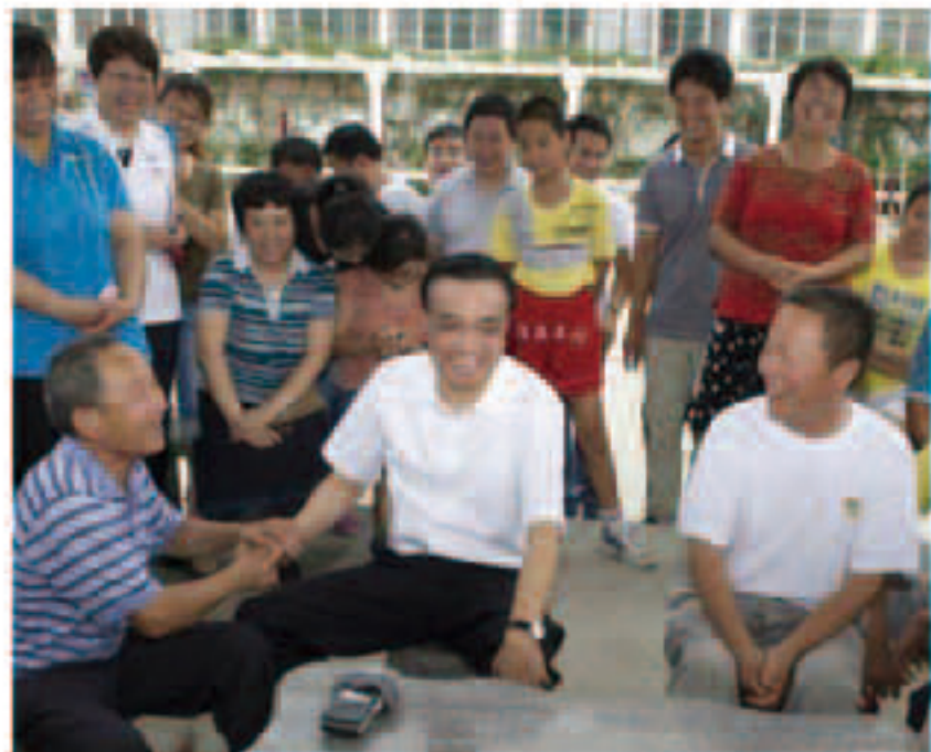
2014年7月24日上午,李克强总理来德州京桥社区亲切询问社区居民的生活状况,并让大家提要求,座谈会大约持续20分钟,总理关心民生问题,非常亲民,座谈会一片欢乐气氛中结束。