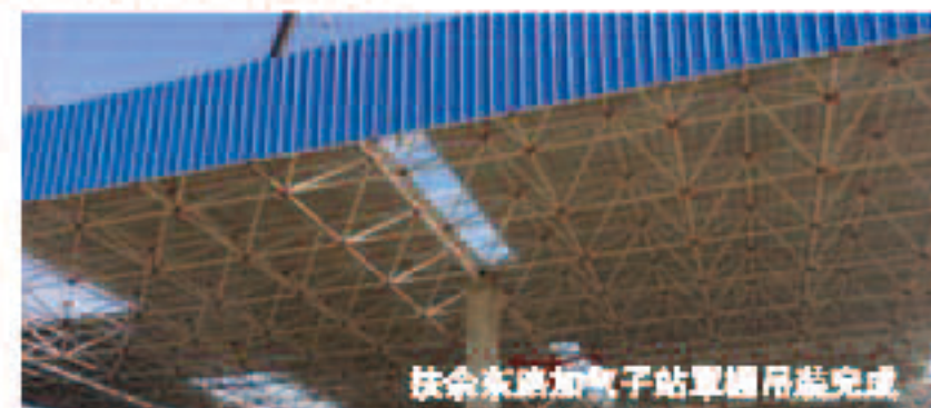
扶余东路加气站罐体吊装完成